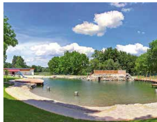
■ von oben nach unten: Naturbadesee Kobersdorf, Erlebnisbad Kaisersdorf, Naturbadesee Markt St. Martin