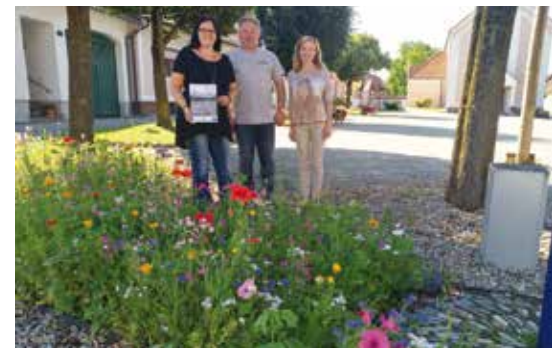
■ Naturspaziergang Mattersburg und Blühfläche in Rudersdorf